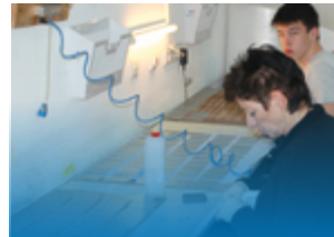
legte den Grundstein für