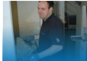
das heute in der vierten